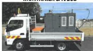
MONTANIER & IVECO